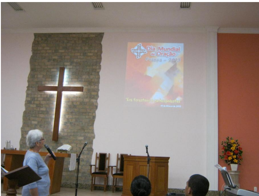
DMO-Bela Aurora-Juiz de Fora