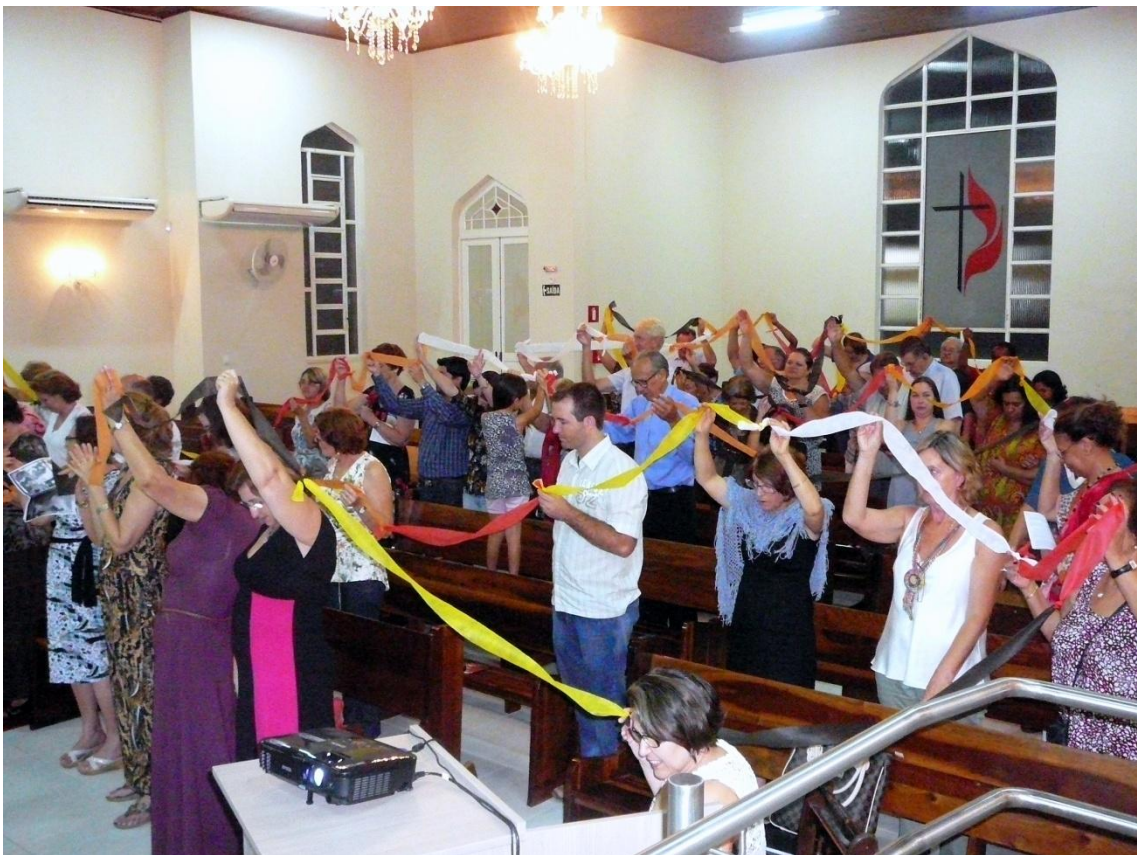
DMO en Sat Maria RS- Brasil