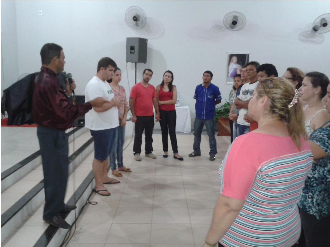
DMO en Ji- Paraná RO- Brasil