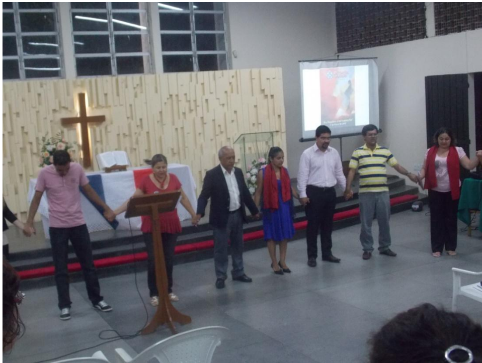
DMO Fortaleza CE Brasil