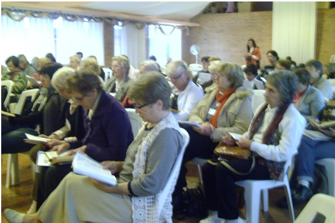
DMO en Uruguai