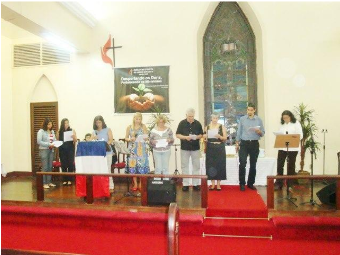
DMO en Jardim Botânico RJ- Brasil