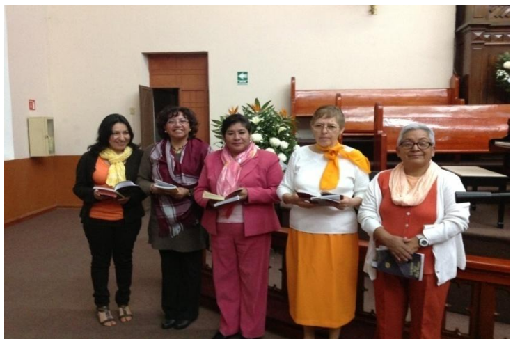
DMO Sociedad Misionera Femenil-Iglesia de México