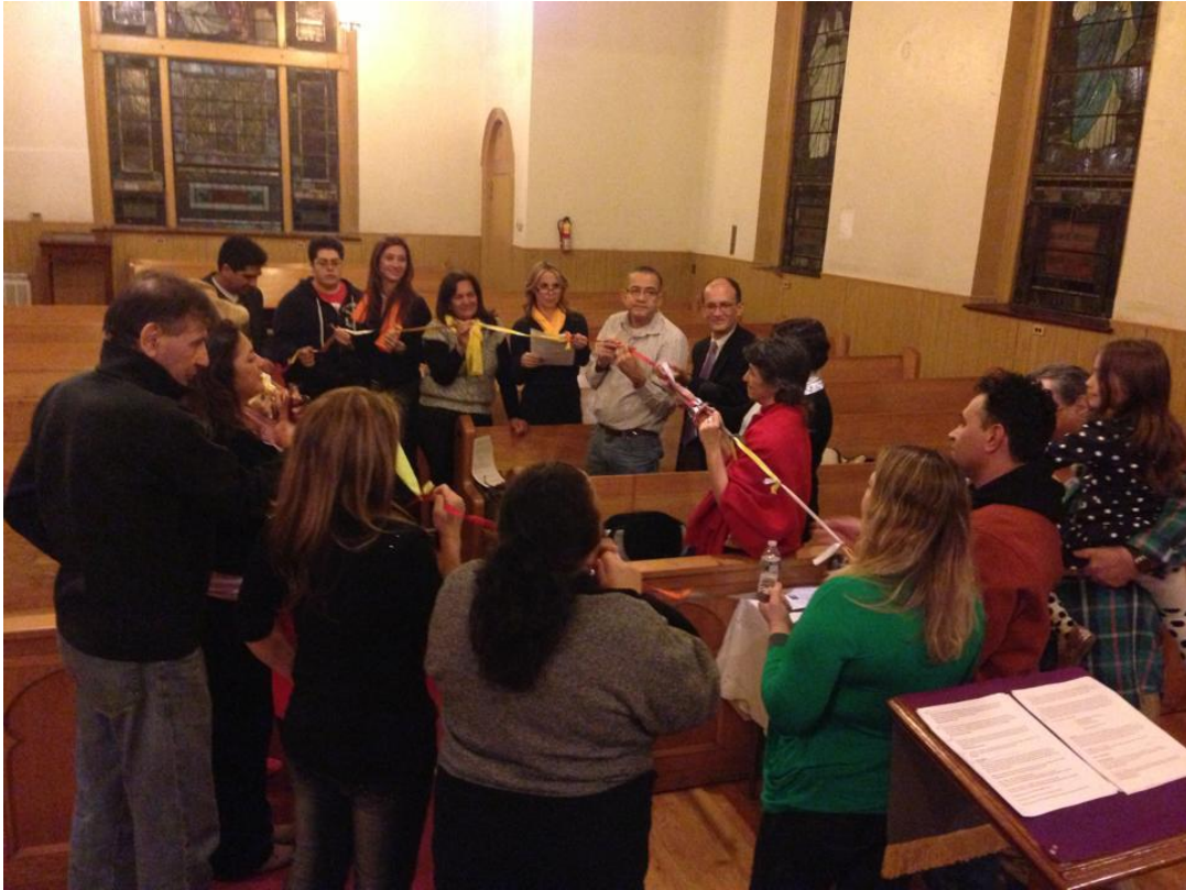
DMO en Harrison New Jersey Estados Unidos