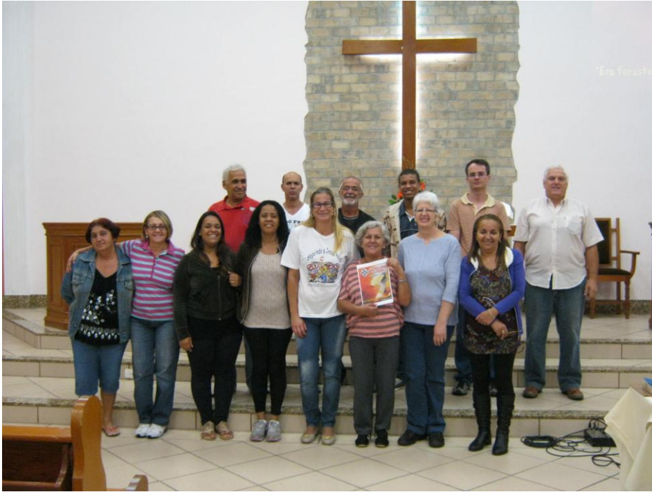
DMO-Bela Aurora-Juiz de Fora