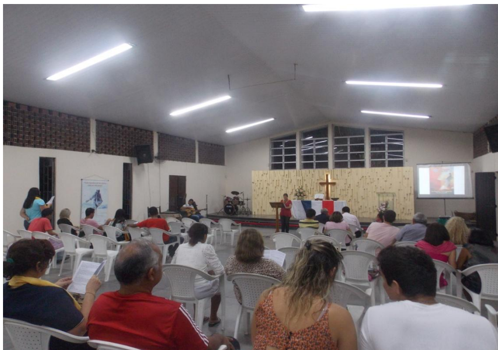
DMO Fortaleza CE Brasil