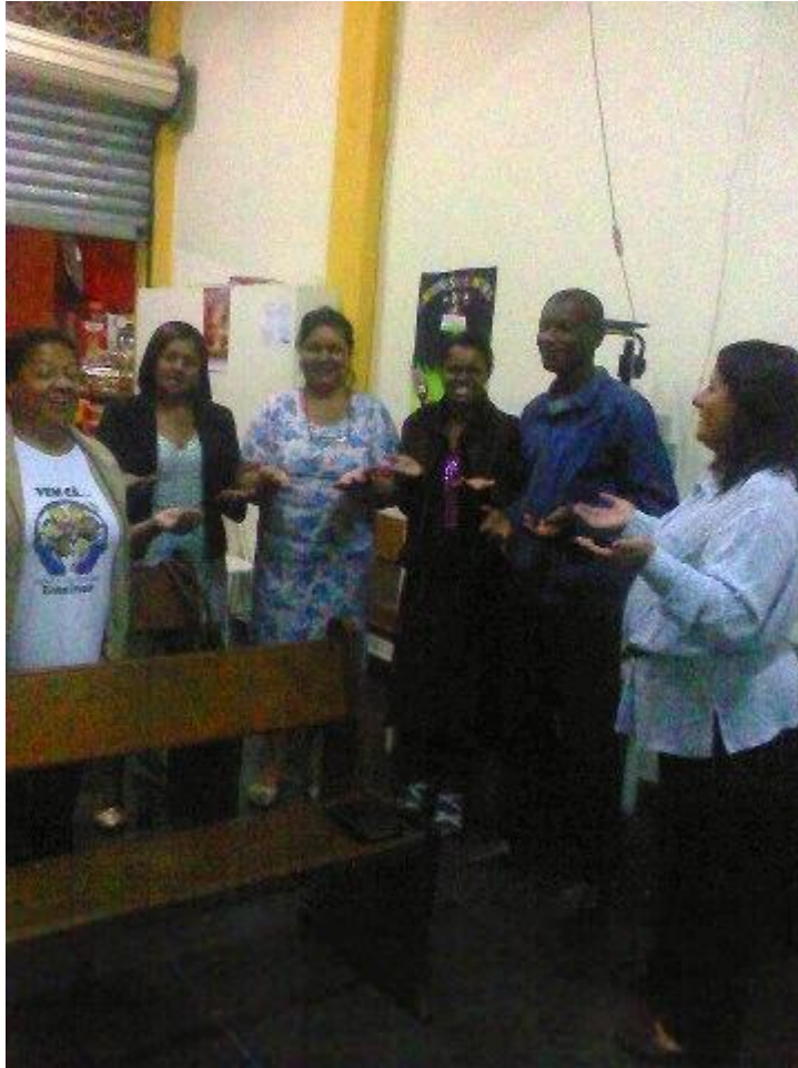
DMO en Água Limpa Volta Redonda RJ- Brasil