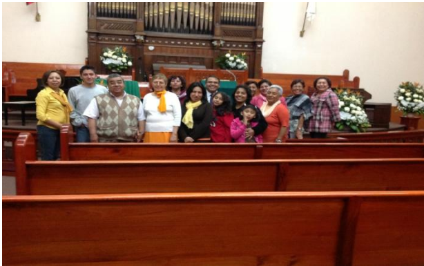
DMO, en Ciudad del Puebla, México