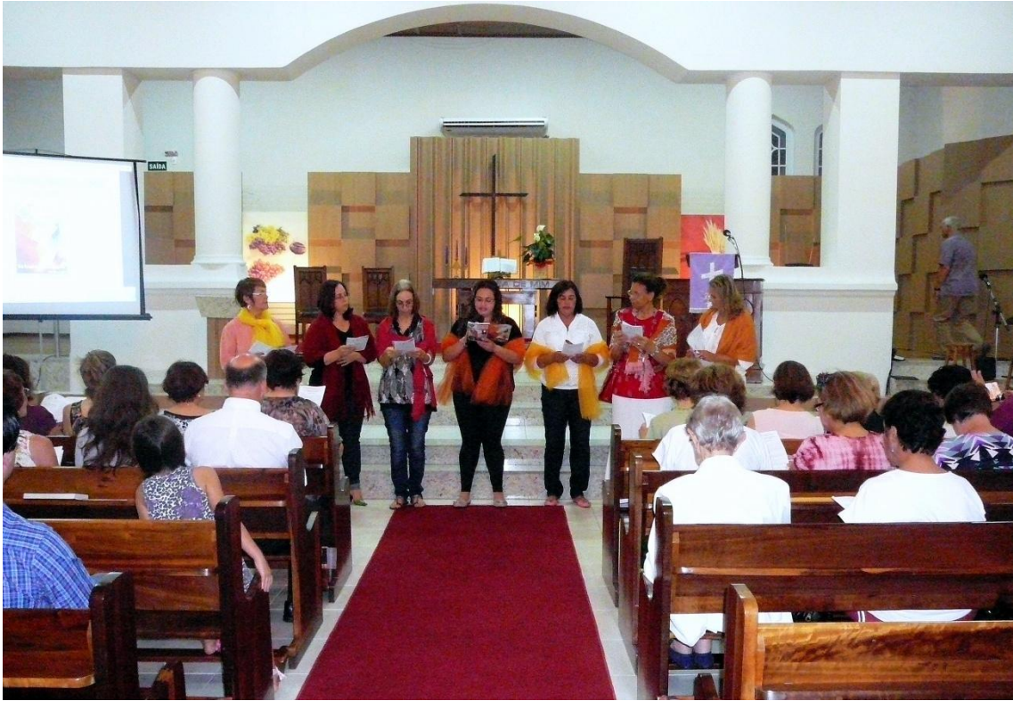
DMO en Sta Maria RS- Brasil