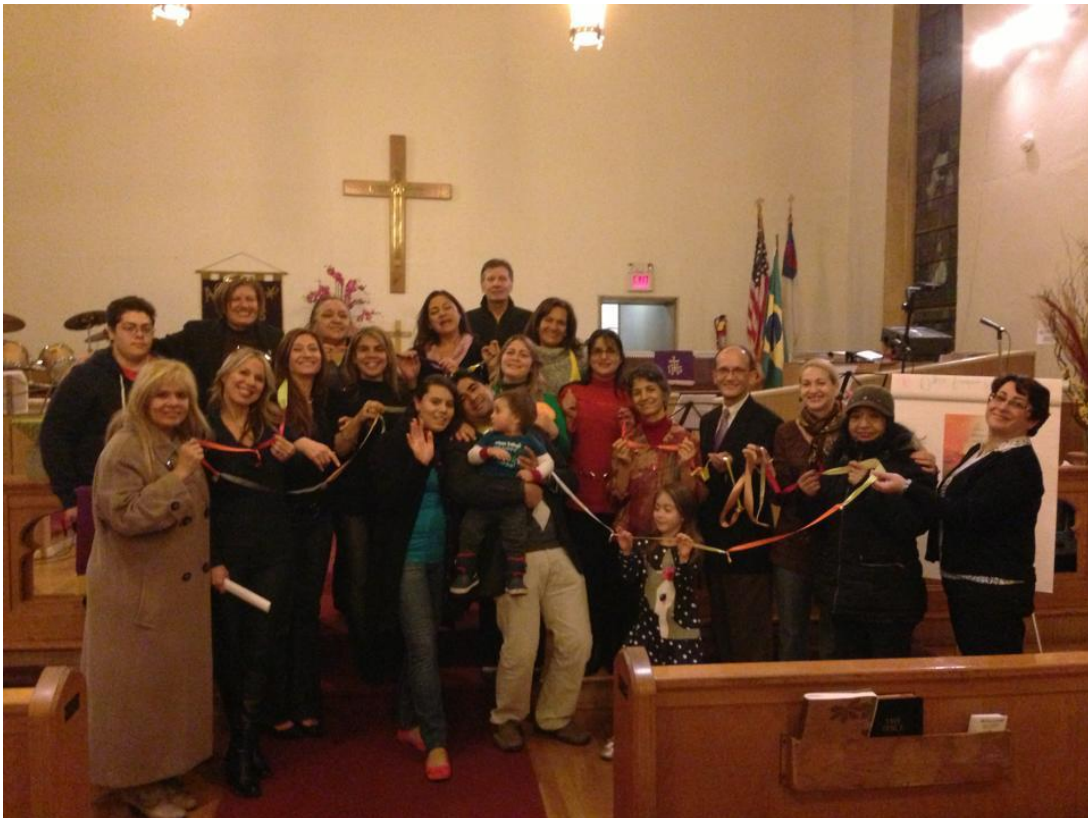
DMO en Harrison New Jersey EU