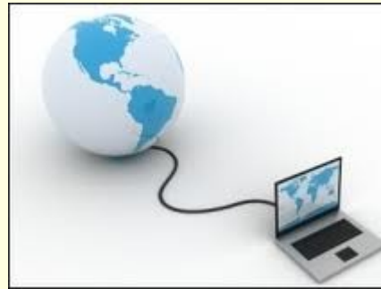
Analista de comunicação