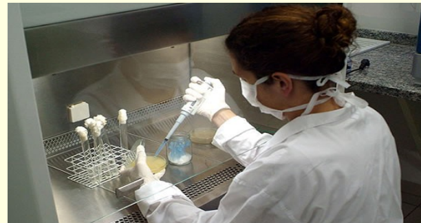
Biofísico e Bioquímico