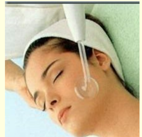
Especialista em Pele