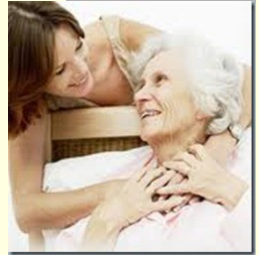
Assistente de saúde / Pessoal