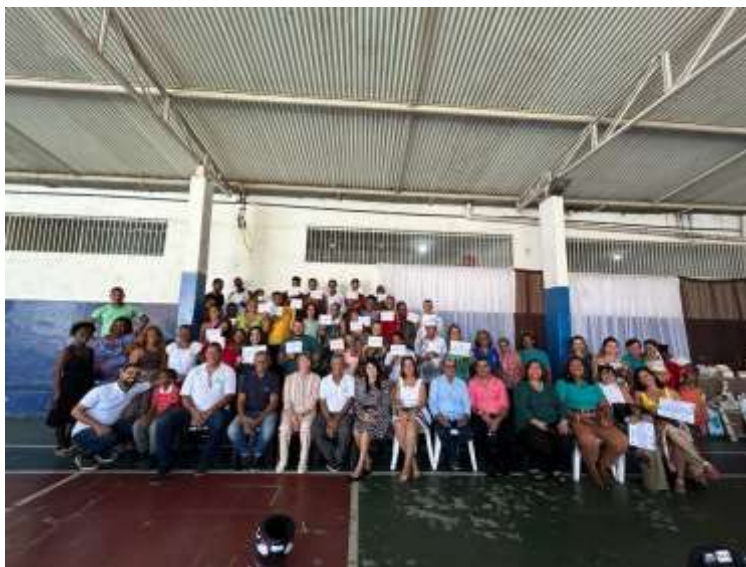
BB FIA – Materiais e Custeio (Oficina de Artesanato)