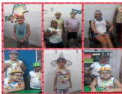
Dia do Abraço