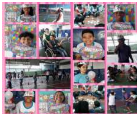
Semana da criança