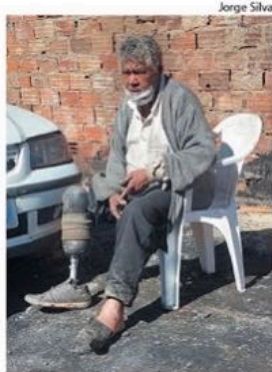
Homem perdeu sua casa e teve seu depósito de reciclagem queimado

O aposentado foi levado para o Hospital Regional de Sorocaba e voltou para casa. Na terça-feira (25), uma equipe da Secretaria de Saúde de Votorantim foi até a residência atendê-lo, mas devido à higienização do lugar, ele teve de ser levado para uma ambulância, onde recebeu os cuidados. (Supervisão: Luciana Lopez)