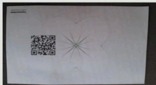
Cartões apresentam marca d'água e QR code