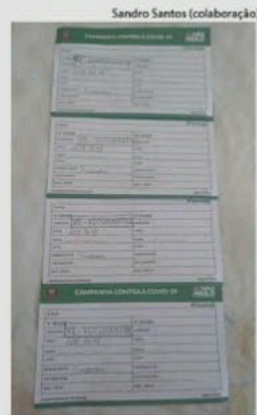
Cartões foram encontrados por moradores