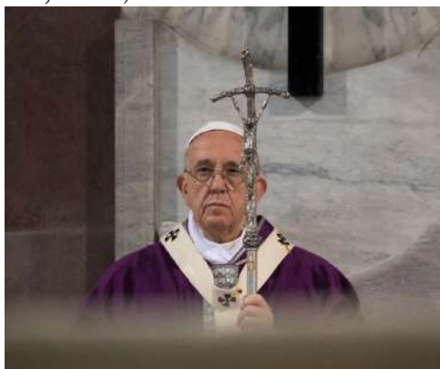
Franciscus Roma, em São João de La- trão, 7 de outubro de 2019, Memória de Nossa Senhora do Rosário.

Invoco a intercessão de Maria Santíssima sobre a próxima Quaresma, para que acolhamos o apelo a deixar-nos reconciliar com Deus, fixemos o olhar do coração no Mistério pascal e nos convertamos a um diálogo aberto e sincero com Deus. Assim, poderemos tornar-nos aquilo que Cristo diz dos seus discípulos: sal da terra e luz do mundo (cf. Mt 5, 13.14).