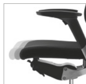
Regulação de profundidade do assento.