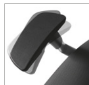
Braços reguláveis em orientação.