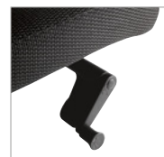
Regulação de tensão.