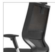
Apoio lombar regulável em altura.