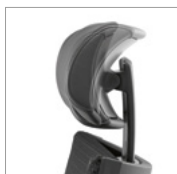
Apoio de cabeça regulável em altura e inclinação.