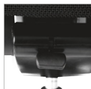
Limitador do curso do movimento da costa.