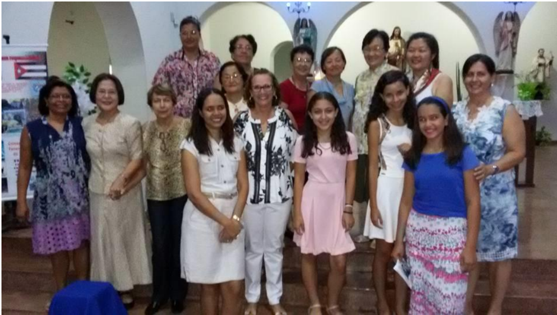
Comissão Ecumênica junto com as colaboradoras na celebração