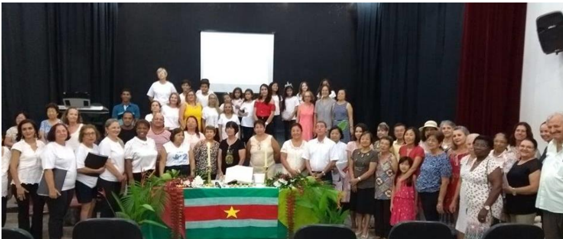
Registrando a presença dos todos os participantes