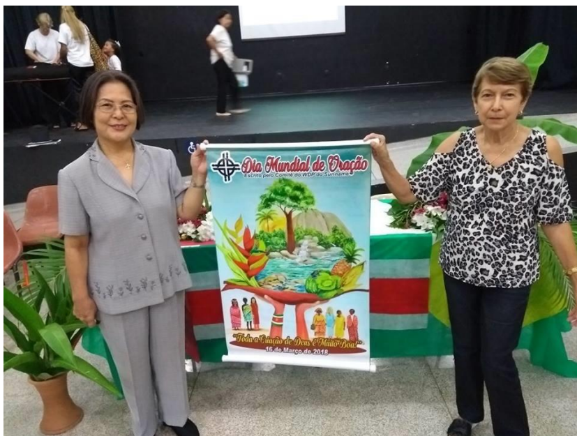
Coordenadoras da IEAB e ICAR