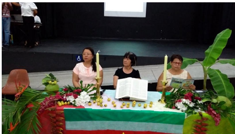
As líderes representantes das igrejas

As três líderes representantes das igrejas conduziram a liturgia, o coral do Centro Espírita animou com a participação das crianças. As 7 mulheres representam das tribos diferentes do Suriname apresentaram bem.