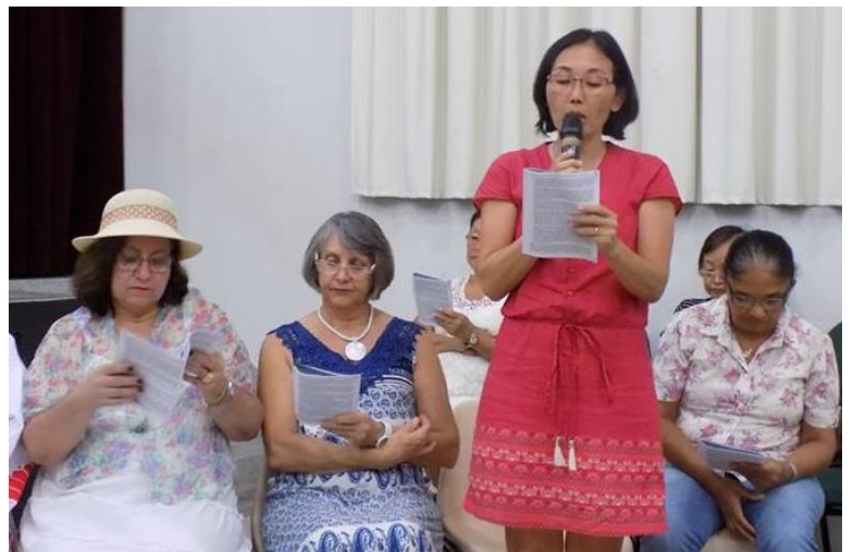
Leitoras composta pelas três igrejas

Este ano, no lugar da mensagem, a comissão pediu para Secretaria de Cultura que colaborou com a encenação do futuro, mostrando como é que vai ser sem cuidado da natureza, sem Água potável e Ar poluído. Foi a mensagem muito forte.