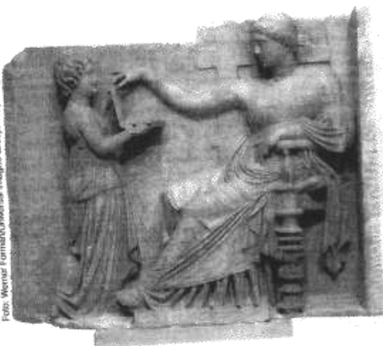
↑ Relevô romano mostra uma mulher e sua serva, século IV.