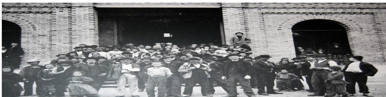
Fundação Patrimônio da Energia de São Paulo - Memorial do Imigrante

Imigrantes em frente à Hospedaria do Imigrante em São Paulo. Guilherme Gaensly, possivelmente na década de 1890.