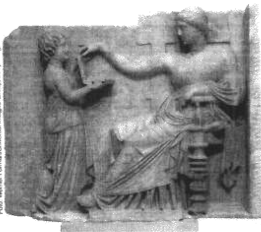
↑ Relevo romano mostra uma mulher e sua serva, século IV.