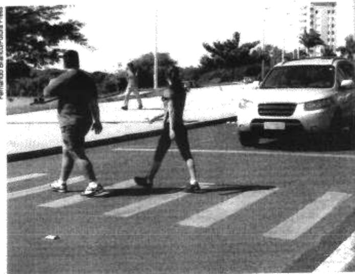
↑ Pessoas atravessam na faixa de pedestres em Itumbiara (GO), 2010.

BRASIL. Congresso. Senado. Lei nº 9.503, de 23 de setembro de 1997. Código de Trânsito Brasileiro , Brasília, DF, p. 35, 2009.