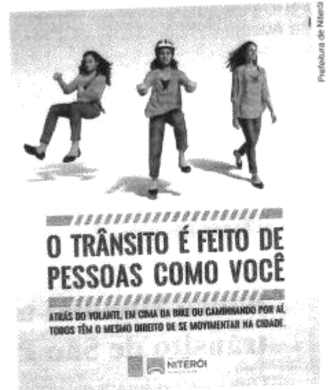
↑ Cartaz de campanha para a educação para o trânsito de Niterói (RJ), 2015.

Analise o cartaz ao lado, de uma campanha para a educação para o trânsito de Niterói (RJ). No cartaz são usadas estratégias de interação verbal e não verbal com o leitor.