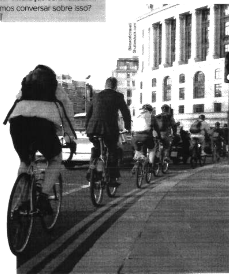
↑ Cidadãos usam bicicleta como meio de transporte em Londres, Inglaterra, 2010.

Avaliação continuada: vamos conversar sobre isso?