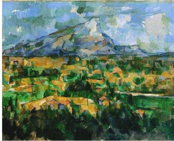
Paul Cézanne - A montanha de Saint Victoire