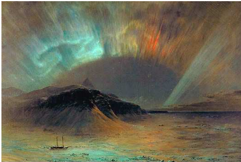
Frederic Church Aurora Boreal