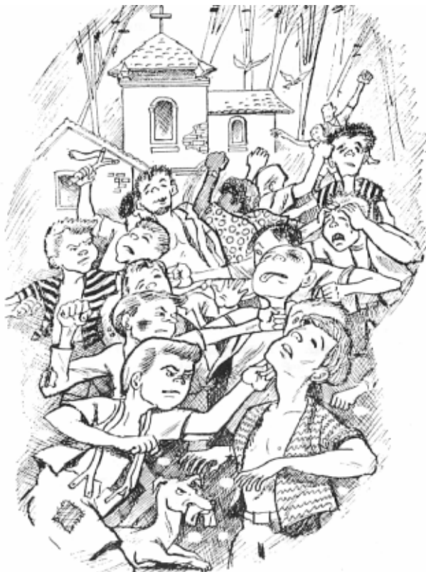
A guerrinha de Tróia fez cantar muitos galos.

vada de mamonas verdes e duras, disparadas por uma bateria de estilingues.