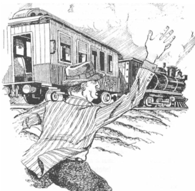
O trem da Sorocabana devorava o chão com dentes de aço.

O pai tomou o menino nos braços e saiu às pressas. Então o homem de branco me disse: “Levante-se da rede e vá depressa à estação. Procure o homem que viu aqui no primeiro vagão da segunda classe e dê-lhe todo o dinheiro que você tem no bolso. A passagem fica por minha conta.” Acordei e saí correndo para a estação. No vagão indicado, logo que o trem chegou, estava o homem com o menino, já babando e de olhos esgazeados. Tirei todo o meu dinheiro do bolso e entreguei ao homem. No mesmo instante surgiu ao meu lado o homem de branco do sonho, que falou com o pai do garoto e lhe deu a passagem para São Paulo. O homem do sonho mal teve tempo de explicar-me: “Ele só tinha passagem até aqui.” O trem deu sinal de partida.