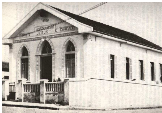
Associação Espírita Jesus e caridade, de Mogi Mirim, fundada em 1933.

Devotados Benfeitores Espirituais estão cooperando em nosso favor, e devemos confiar na proteção de Jesus, hoje e sempre.”“.