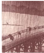
(2) Kioto, antiga capital do Japão.

Pedir-lhe perdão pela minha atitude agressiva e imperdoável, foi tudo o que pude fazer em nosso reencontro, mas, ali mesmo, ante os céus de Kioto (2) implorei aos nossos antepassados me doassem, um dia, a mesma sentença ao seu lado, de modo a me sentir exonerado do arrependimento que me feria todas as fibras do espírito.