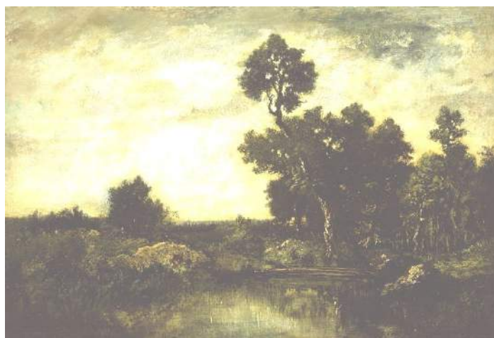
Théodore Rousseau A Paisagem 2