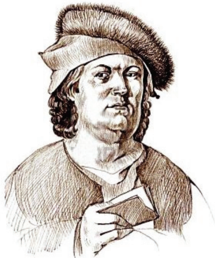
Theophrastus Bombastus Von HOHENHEIM ou PARACELSO (1493-1541)