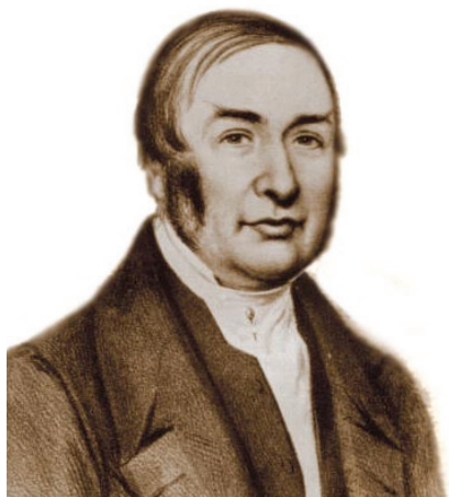
James Braid (1795-1860)

"O Espiritismo e o Magnetismo nos dão a chave de uma infinidade de fenômenos sobre os quais a ignorância tece muitas fábulas, em que os fatos são exagerados pela imaginação. O conhecimento dessas duas ciências, que se resumem numa só, é o melhor preservativo contra as idéias supersticiosas, porque revela o que é impossível, o que está nas leis da Natureza e o que não passa de crença ridícula."