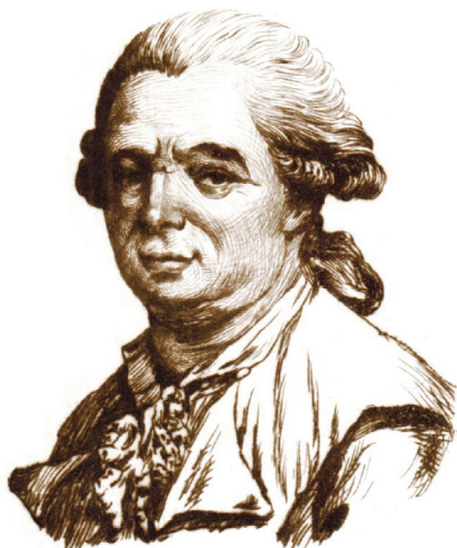
Franz Anton MESMER (1734-1815)

várias décadas o que veio a ser estudado pelo hipnotismo, espiritismo e pela parapsicologia".