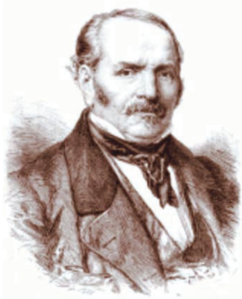
Allan Kardec (1804-1869)