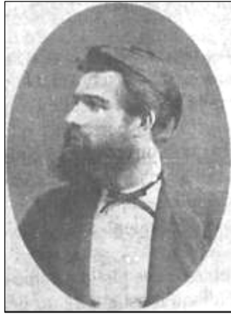
Édouard Buguet, o médium-fotógrafo (Da Revue Spirite , 1874, p. 147)