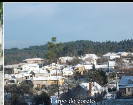
Largo do coreto