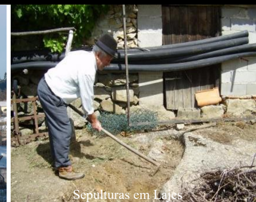
Sepulturas em Lajes