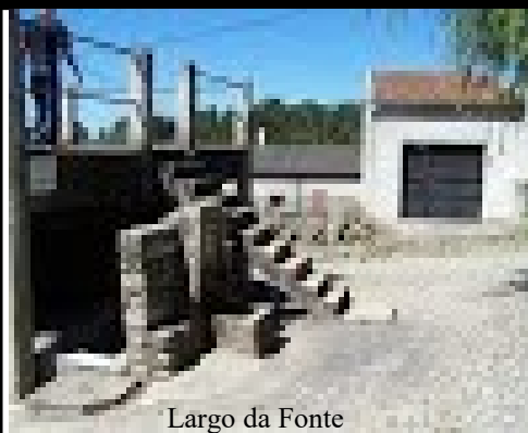
Largo da Fonte

Ladeia o portal duas pequenas aberturas emolduradas tipo postigo. Pilastras nos cunhais. Paredes em alvenaria rebocadas.